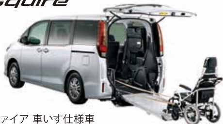
エスクアア 車いす仕様車