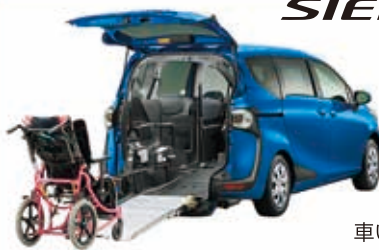
シエンタ 車いす仕様車