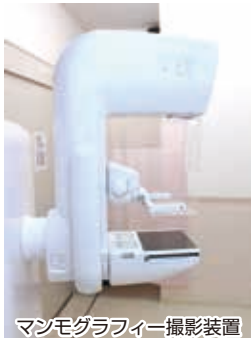
マンモグラフィ撮影装置