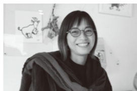
表紙イラスト作者 トダユカさん