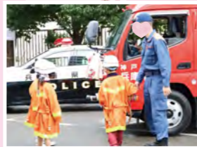
#警察&消防車両見学