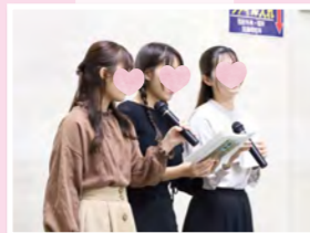
#神戸看護大学 コーラルレイン