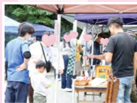
#ケータリング #軽食販売