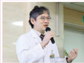
#開会宣言 #朝田院長

2025年10月26日(日) 第5回 百年いきいきフェスタ開催しました! たくさんのご来場ありがとうございました!