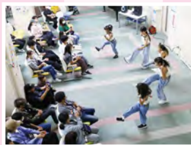
#キッズダンスショー #RSダンススクール