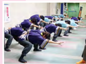
#神戸学生よさこいチーム 湊